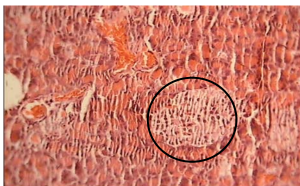
شکل ۲- جزایر لانگرهانس در برش عرضی لوزالمعده (رنگ‌آمیزی هماتوکسیلین-انوزین، بزرگنمایی 100\times ) گروه کنترل غیردیابتی