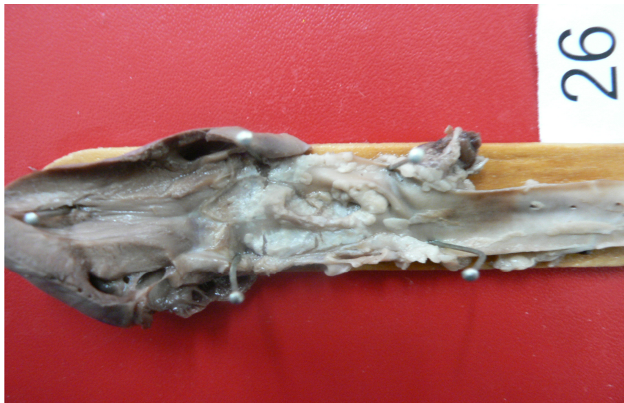
شکل ۲- ضایعات عروقی قوس آئورت و آئورت توراسیک (گروه هیپرکلسترولمیک و معتاد)