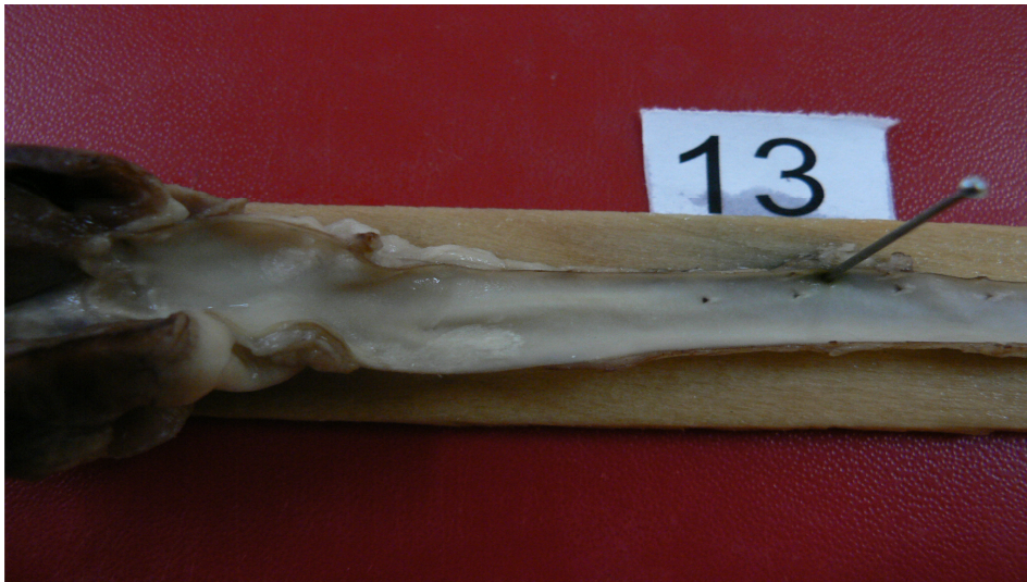
شکل ۱- ضایعات عروقی قوس آئورت و آئورت توراسیک (گروه هیپرکلسترولمیک)