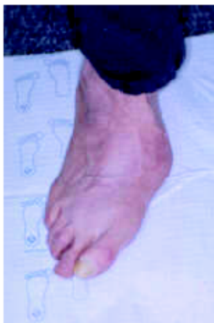
شکل ۱-ب- پای دیابتی شارکو (۴)

اختلالات ساختاری مادرزادی، ضایعات عصبی، بیومکانیک غیرطبیعی و جراحی‌های قبلی همگی می‌توانند به بروز بدشکلی‌های ساختاری در پا منجر شوند. این بدشکلی‌ها زمینه بروز زخم فشاری (pressure ulcer) را در پا فراهم می‌کنند.