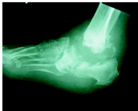
شکل ۱-الف- استئوآرتروپاتی مچ پا (۴)

در درجه حرارت حدود ۷۰ درجه فارنهایت که مربوط به یک پای پوشیده شده می‌باشد، نیاز هر ۱۰۰ گرم بافت به خون حدود ۱۰۰ ml/min می‌باشد، اما اگر درجه حرارت