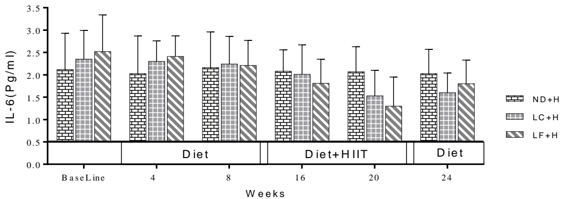
*.ND+H Vs Other groups; &.LC+H Vs Other groups;$. LF+H Vs Other groups.

غلظت IL-6 اختلاف معنی‌داری بین گروه‌های مداخله‌ای در هفته‌ی ۴ ( F=4/813, p=0/006 ) و هفته‌ی ۲۰ ( F=4/746, P=0/007 ) نشان داد، و در سایر هفته‌ها این اختلاف معنی‌دار مشاهده نشد. پس از ۲۴ هفته مداخله، گروه LC+H ( F=2/135, P=0/001 ) و گروه LF+H ( F=3/548, P=0/014 ) افت معنی‌داری در مقایسه با