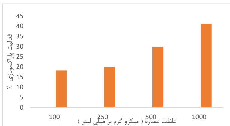
شکل ۳- درصد فعال سازی پاراکسوناز ۱ سرمی فرد سالم تحت تأثیر غلظت های مختلف عصاره ی آویشن داده ها به صورت انحراف استاندارد ± میانگین و با سه تکرار نشان داده شده اند.

در صد مهار رادیکال 1 mg/ml از عصاره ی هیدروالکلی آویشن ۰/۶۳ ± ۸۰/۵۴٪ و IC 50 آن برابر ۲۲/۸۹ ± ۴۷۷/۵ میکروگرم بر میلی لیتر بود (IC 50 استاندارد ۵۸/۵۷ ± ۹/۸ میکروگرم بر میلی لیتر).