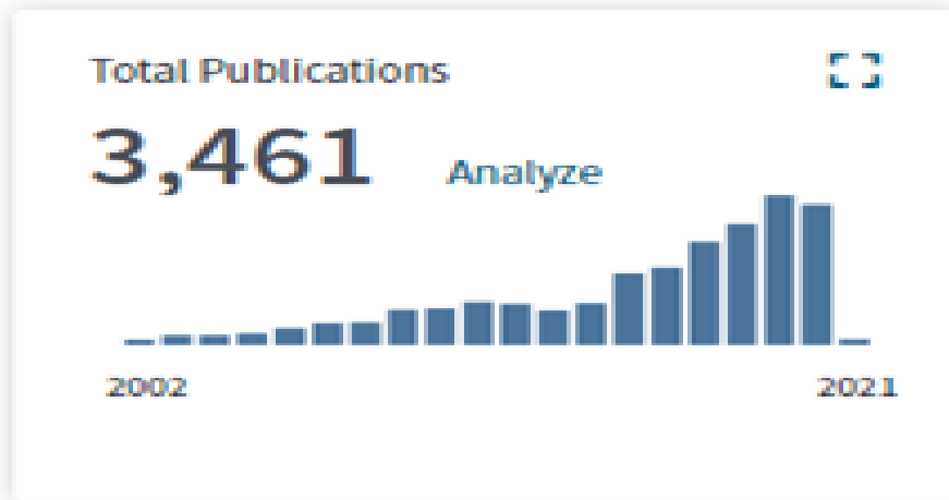
شکل ۱- تعداد مقالات چاپ شده پژوهشگاه علوم غدد و متابولیسم در ۲۵ سال گذشته

دیابت" ( http://emri.tums.ac.ir/DMNet NDRN) [۸] و "شبکه‌ی تحقیقات پوکی استخوان ایران" [۹] را ایجاد کرد] ( http://emri.tums.ac.ir/OsteoNet ) که در همان سال‌ها مورد تأیید وزارت بهداشت (۲۰۰۲) قرار گرفت. با همکاری NDRN، راهنمای بالینی دیابت برای کشور تهیه و منتشر شد [۱۰]. در حال حاضر، بیش از ۲۰ دانشگاه در سراسر کشور عضو این شبکه‌ها هستند.