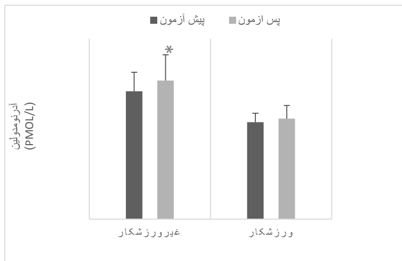
نمودار ۳- تغییرات آدرنومدولین قبل و پس از دوره‌ی مطالعه

*نشانه‌گر تغییرات معنی‌دار با مقادیر پیش‌آزمون