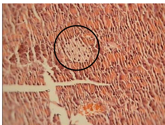
شکل ۱- جزایر لانگرهانس در برش عرضی لوزالمعده (رنگ‌آمیزی هماتوکسیلین-ائوزین، بزرگنمایی 100\times ) گروه کنترل دیابتی شده با آلوسکان

نتایج نشان داد که در نوبت ۱، میانگین فاکتورها در بین گروه‌های مورد مطالعه تفاوت معنی‌داری نداشته است (جدول ۱ و ۲). در نوبت ۲ میزان قند، VLDL و LDL خون در گروه کنترل دیابتی در مقایسه با گروه کنترل غیردیابتی و گروه پیشگیری افزایش معنی‌داری ( P < 0/05 ) یافته و تفاوت معنی‌داری بین گروه‌های کنترل غیردیابتی و پیشگیری دیده نشد. به‌علاوه در گروه کنترل دیابتی در نوبت ۲ در مقایسه با نوبت ۱ افزایش معنی‌داری ( P < 0/05 ) در تمامی فاکتورهای ذکر شده دیده شد. در نوبت ۳ در گروه پیشگیری تفاوت معنی‌داری در مقایسه با گروه کنترل غیردیابتی دیده نشد (جدول ۱ و ۲). در نوبت ۲ میزان انسولین در گروه پیشگیری تفاوت معنی‌داری با گروه کنترل غیردیابتی نداشته ولی گروه کنترل دیابتی نسبت به گروه کنترل غیر دیابتی کاهش معنی‌داری ( P < 0/05 ) را نشان داده است (جدول ۱). هموگلوبین گلیکوزیله فقط در نوبت ۳ در گروه کنترل دیابتی در مقایسه با سایر