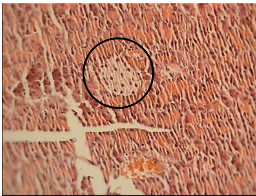
شکل ۱- جزایر لانگرهانس در برش عرضی لوزالمعده (رنگ‌آمیزی هماتوکسیلین-ائوزین، بزرگنمایی 100\times ) گروه کنترل دیابتی شده با آلوکسان

نتایج نشان داد که در نوبت ۱، میانگین فاکتورها در بین گروه‌های مورد مطالعه تفاوت معنی‌داری نداشته است (جدول ۱ و ۲). در نوبت ۲ میزان قند، VLDL و LDL خون در گروه کنترل دیابتی در مقایسه با گروه کنترل غیردیابتی و گروه پیشگیری افزایش معنی‌داری ( P < 0/05 ) یافته و تفاوت معنی‌داری بین گروه‌های کنترل غیردیابتی و پیشگیری دیده نشد. به‌علاوه در گروه کنترل دیابتی در نوبت ۲ در مقایسه با نوبت ۱ افزایش معنی‌داری ( P < 0/05 ) در تمامی فاکتورهای ذکر شده دیده شد. در نوبت ۳ در گروه پیشگیری تفاوت معنی‌داری در مقایسه با گروه کنترل غیردیابتی دیده نشد (جدول ۱ و ۲). در نوبت ۲ میزان انسولین در گروه پیشگیری تفاوت معنی‌داری با گروه کنترل غیردیابتی نداشته ولی گروه کنترل دیابتی نسبت به گروه کنترل غیر دیابتی کاهش معنی‌داری ( P < 0/05 ) را نشان داده است (جدول ۱). هموگلوبین گلیکوزیله فقط در نوبت ۳ در گروه کنترل دیابتی در مقایسه با سایر