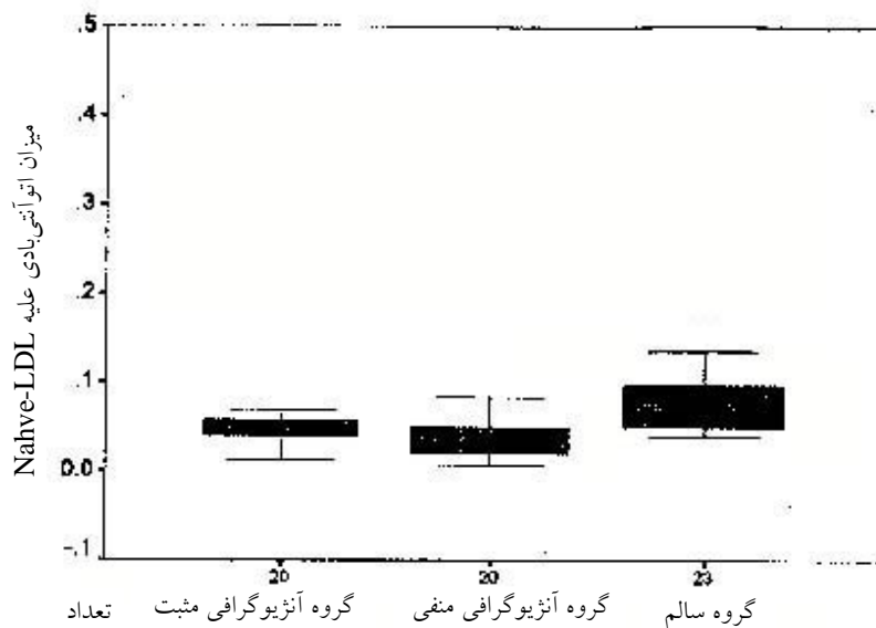
شکل ۱- مقایسه پراکندگی تیترا اتوانتی بادی علیه Native-LDL به روش الیزا