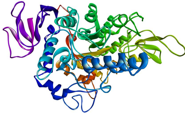
شکل ۱- ساختار سه بعدی (3D) آنزیم آلفاگلوکوزیداز با کد PDB:3a4a.