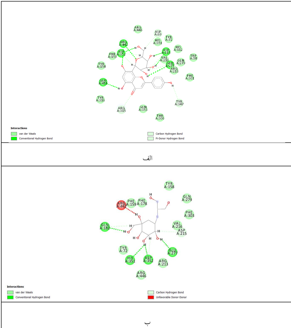
شکل ۲- نمای دوبعدی (2D) از اینتراکشن آلفاگلوکوزیداز و دو مهارکننده (الف) میان آنزیم و ترکیب Vitexin. (ب) میان آنزیم و ترکیب Voglibose