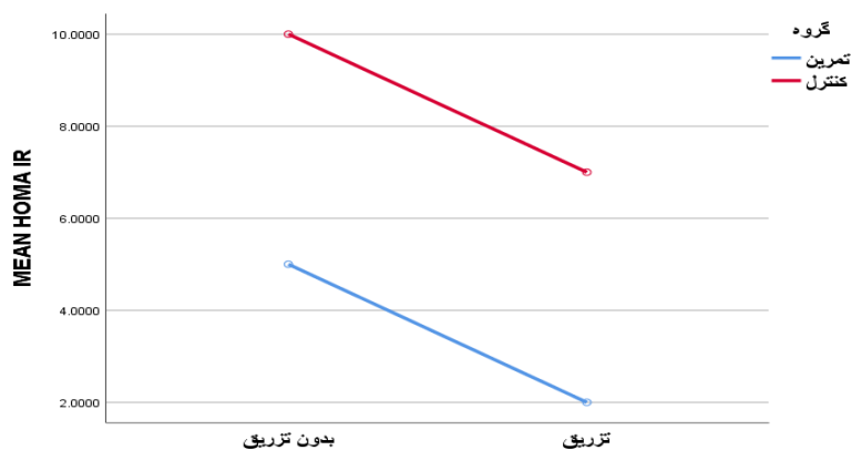
شکل ۲- نمودار میانگین بیان فاکتور HOMA-IR در رت‌های دیابتی