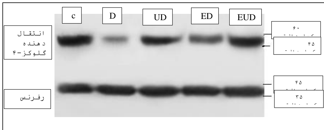
شکل ۱- تصاویر مربوط به باند پروتئین glut4 در گروه‌های مورد مطالعه

شماره‌ی آنتی بادی GLUT-4: ab216661. GAPDH: ab181602